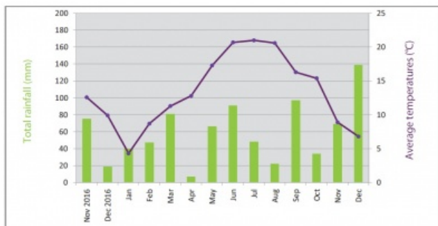
Comparatif des températures et précipitations sur la période végétative : du 1er mars au 31 octobre