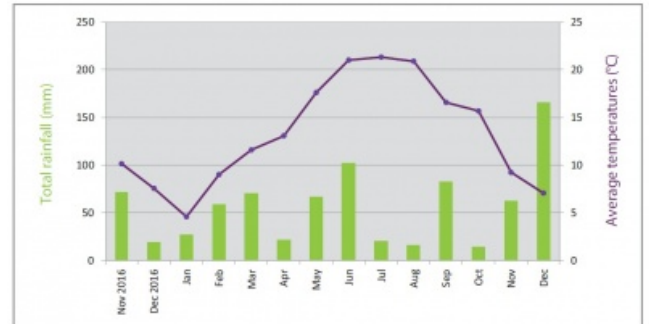
Comparatif des températures et précipitations sur la période végétative : du 1er mars au 31 octobre