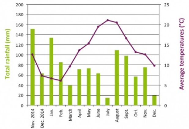
Comparatif des températures et précipitations sur la période végétative : du 1er mars au 31 octobre